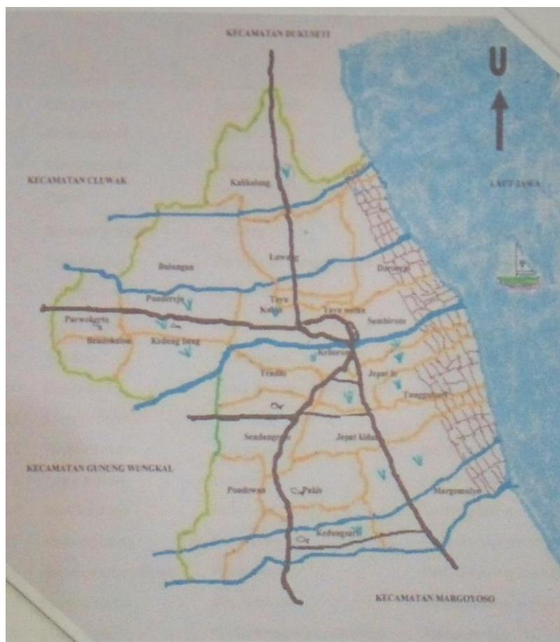
Peta Kecamatan Tayu

Kawasan perencanaan yang menjadi lingkup kerja Kecamatan Tayu dapat dilihat dalam tabel II.6 berikut ini :