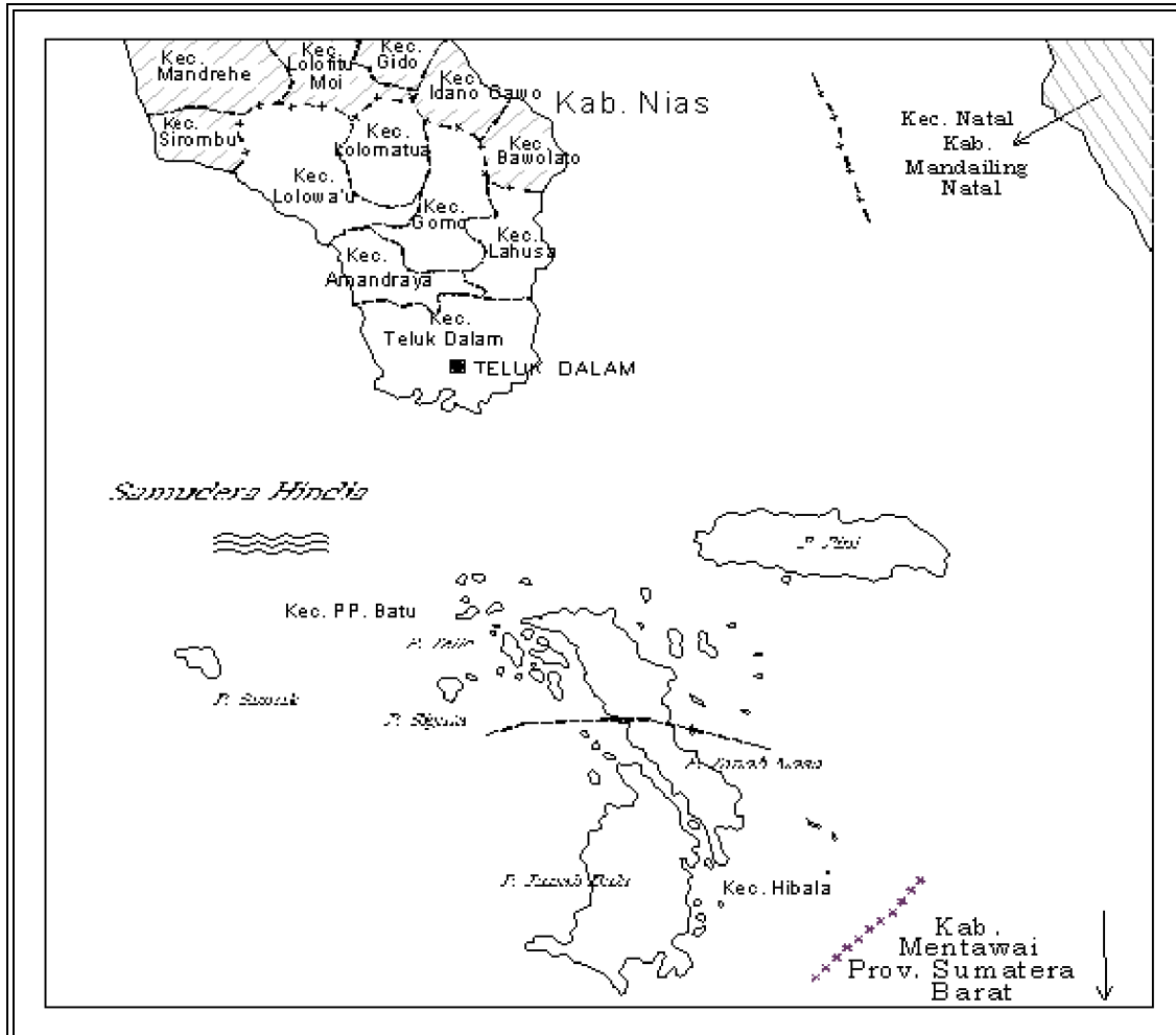
PETA KABUPATEN NIAS SELATAN

KETERANGAN : +++++++ : Batas Provinsi +++++++ : Batas Kabupaten ----- : Batas Kecamatan